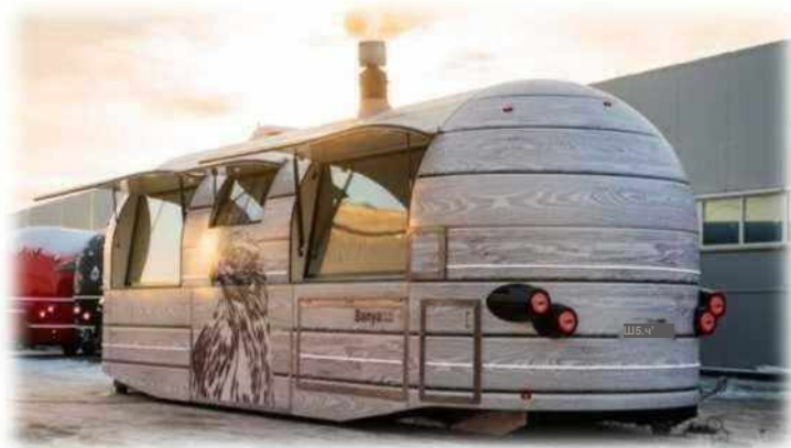
Баня на колёсах